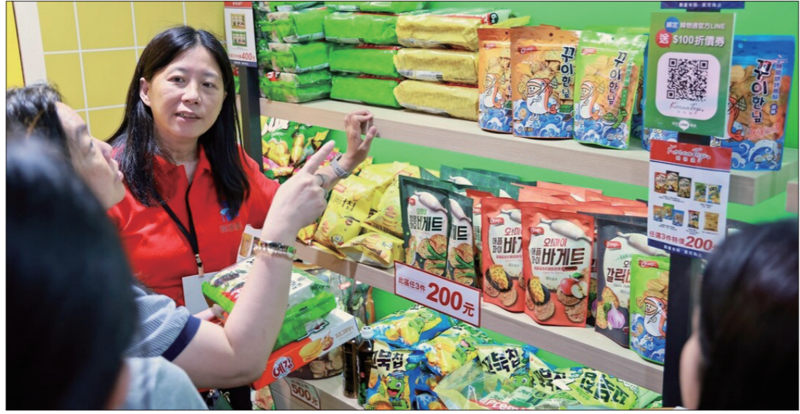
▲한국제품을 설명하고 있는 현지관계자