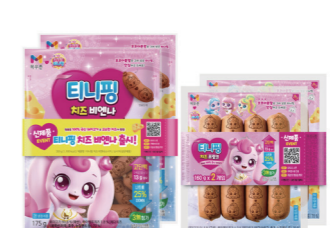
▲티니핑 치즈 프랑크소시지

농협목우촌(대표이사 박철진)은 SAMG엔터의 대표 캐릭터 '캐치! 티니핑'과 콜라보한 '티니핑 치즈 비엔나 소시지'와 '티니핑 치즈 프랑크 소시지' 2종을 출시했다.