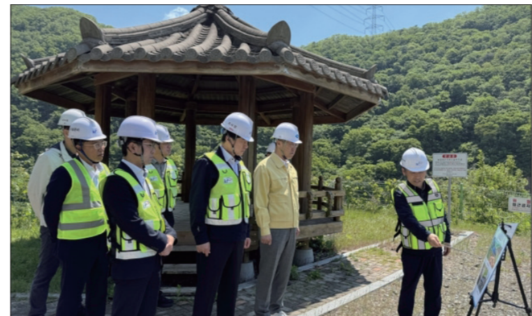
▲우기대비 농업기반시설 안전점검