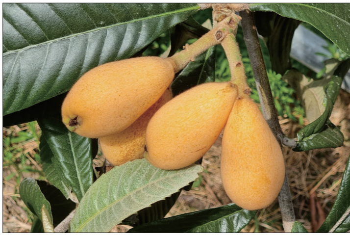
▲전남농기원이 자체 개발한 비파신제품 조아비

현재 전남 지역의 비파 재배 규모는 83.8ha로 144농가에서 연간 156톤이 생산되고 있다.